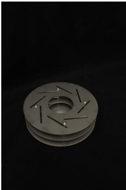
Sockel zum Aufstellen ohne Brennkammer und Glaspaneele

Ebenfalls sollte der Aufstellungsort so gewählt werden, dass auch jede absehbar bewegliche Risikoquelle minimiert werden kann. Dies können zum Beispiel auch trotz aller Vorsicht unbeaufsichtigte Kinder sein, welche zwischen die Glaspaneele greifen oder auch wehende Kleidungsstücke vorbeigehender Personen. Da die Höhe der Kaminflamme besonders im Zusammenhang mit Zirkulation der Umgebungsluft variieren kann, sollte jedes Risiko durch Gegenstände, welche über die Flamme geraten könnten, ebenfalls vermieden werden.